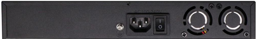
Рис.2 Коммутатор SW-61621(300W) (вид сзади)