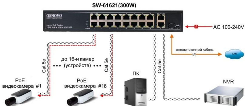
Рис.4 Типовая схема подключения коммутатора SW-61621(300W)