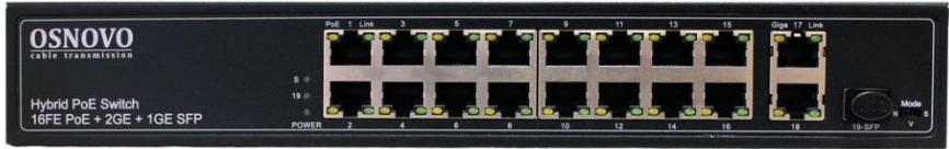
Рис.1 Коммутатор SW-61621(300W) (вид спереди)