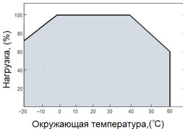
Кривая снижения характеристик