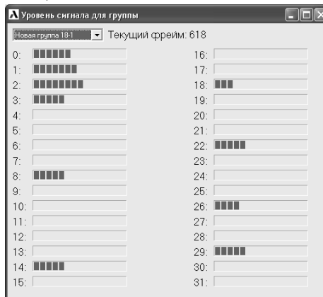
Рис. 2. Пример проверки уровня сигнала

В центре охраны в основном меню ПО выберите раздел Правка/Просмотр уровня сигнала и группу, в которую записан данный приемопередатчик. На экране компьютера появится окно, пример которого приведен на рис. 2.