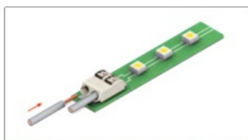
Кабель с однопроводной жилой вставляется без инструмента.

Клеммы считывателя позволяют производить быстрое подключение без использования инструмента. Вы можете использовать кабель с однопроводными или многопроводными жилами общим сечением от AWG24 (0,2мм 2 ) до AWG18 (0,82мм 2 ), например, КСПВ 8x0,5, стандартная витая пара CAT5.