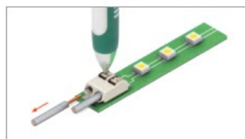
Любой кабель отсоединяется после нажатия на фиксатор клеммы.