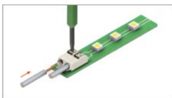
Кабель с многопроводной жилой вставляется после нажатия на фиксатор клеммы.