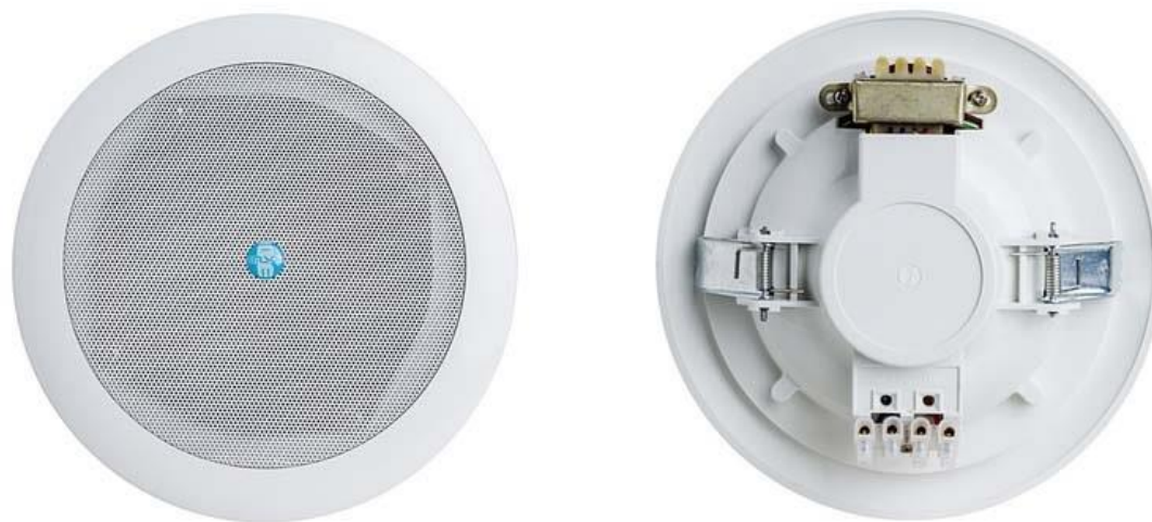
Рис. 1. Внешний вид громкоговорителя.

Внешний вид громкоговорителя показан на рис. 1.