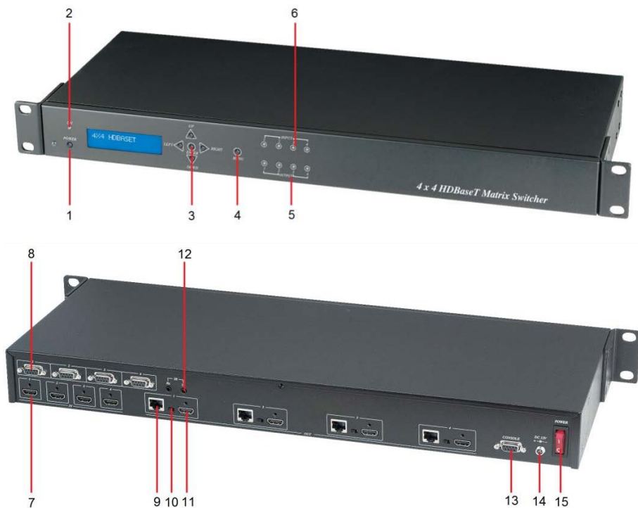
Рис. 5 Элементы коммутатора HE04M