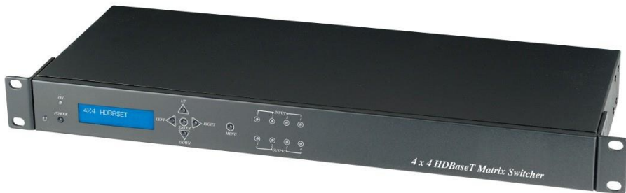
Рис.1 Вид спереди HE04M