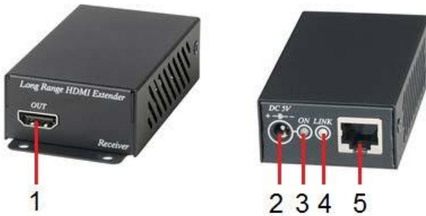
Рис. 6 Элементы коммутатора HE02ER