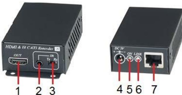
Рис. 7 Элементы коммутатора HE02EIR