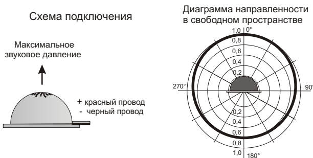
Рис.2 Схема подключения и диаграмма направленности оповещателя .