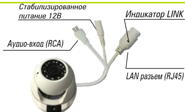
Рис. 1 Схема подключения видеокмеры