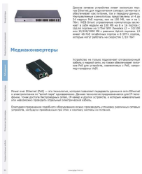
Раздел каталога "PoE...