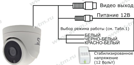
Рис.1 Схема подключения