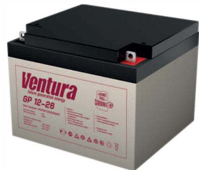
Габаритные размеры, мм