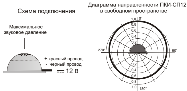
Рис.2 Схема подключения и диаграмма направленности звука оповещателя ПКИ-СП12.

5.3. На рис.2 показана схема подключения и диаграмма направленности звука ПКИ-СП12.