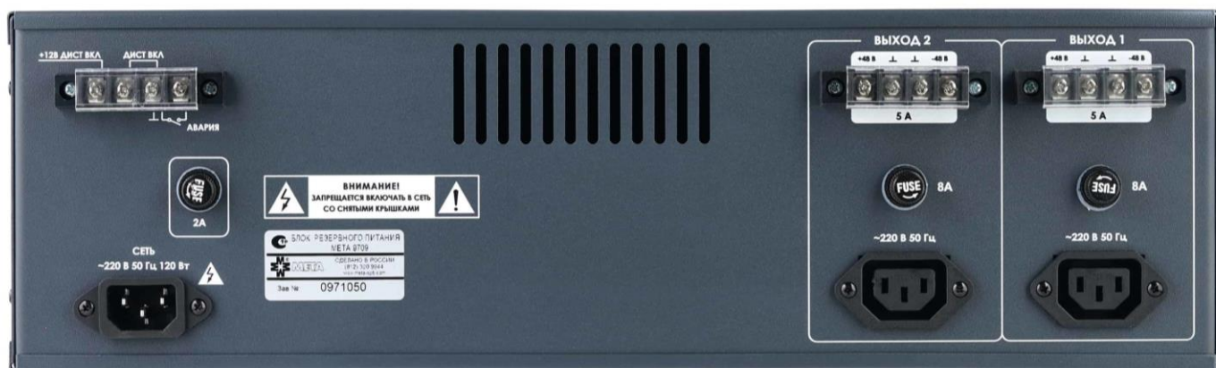
Рисунок 2. Внешний вид задней панели БРП.