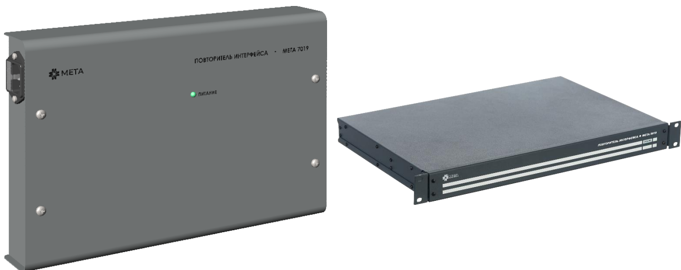
Рисунок 1. Внешний вид ПИ МЕТА 7019 (слева) и ПИ МЕТА 9019 (справа).