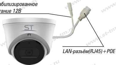
Рис.1 Схема подключения видеокмеры