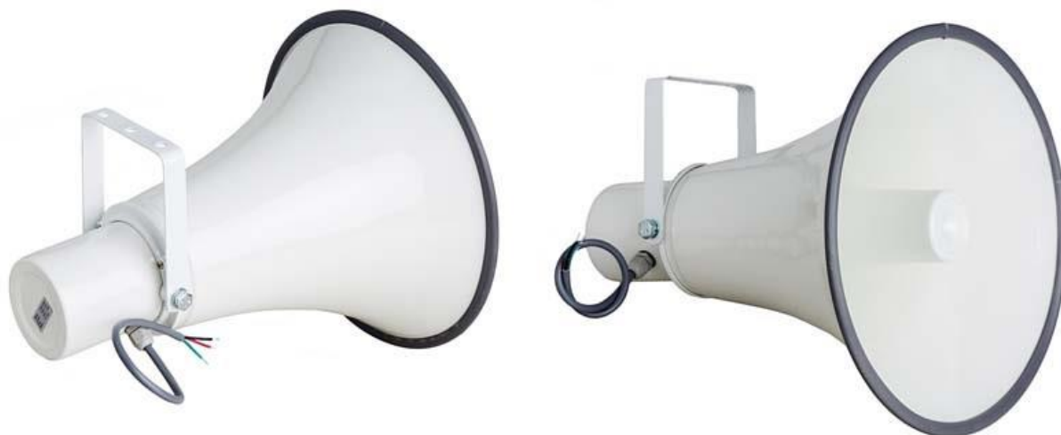
Рис. 1. Внешний вид громкоговорителя.

Внешний вид громкоговорителя показан на рис. 1.