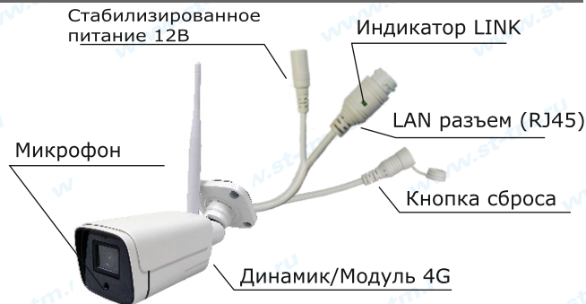
Рис. 1 Схема подключения видеокмеры