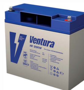
Габаритные размеры, мм