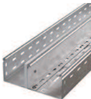
Вертикальный монтаж перегородки DD к разделительной металлической перегородке SEP