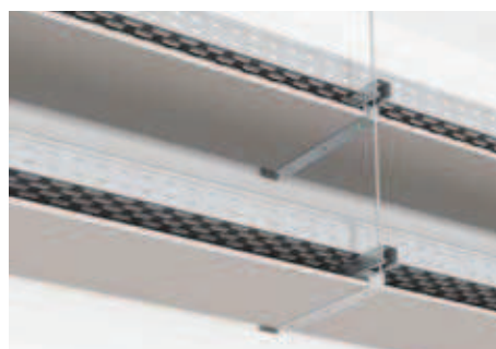
Горизонтальная установка перегородки DD держателями серии ВМЗ-15