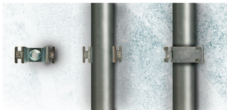
Установка базы держателя на стену