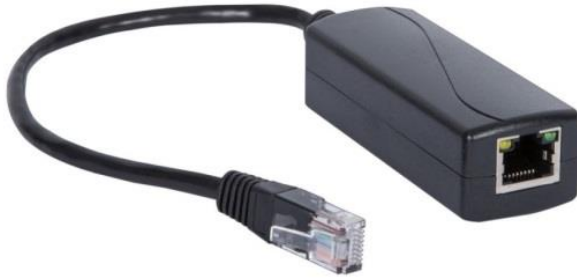
Рис.1 Конвертер CN-PoE24/G, внешний вид