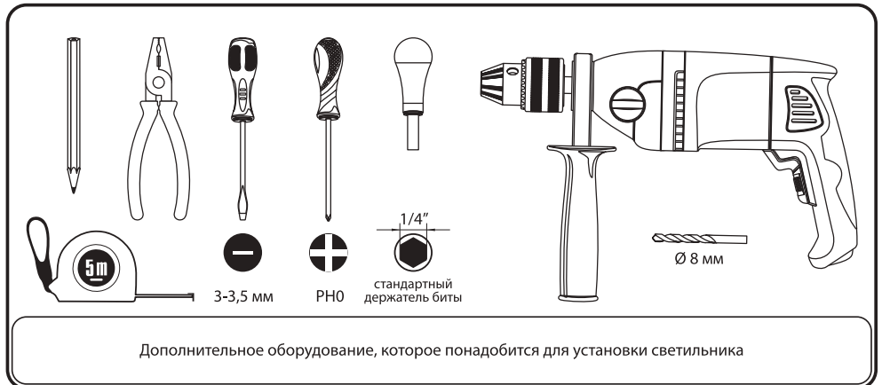
Дополнительное оборудование, которое понадобится для установки светильника