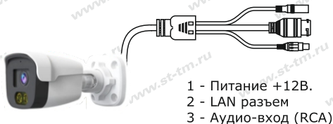
Рис. 1 Схема подключения видеокамеры