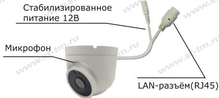
Рис. 1 Схема подключения видеокамеры