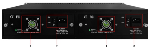
Рис.1 Разъемы и индикаторы на задней панели