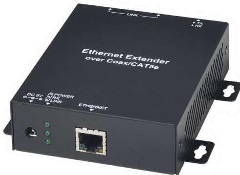
Рис.1 Приемник и передатчик из комплекта IP02DK, внешний вид