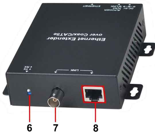
Рис. 3 Приемник и передатчик из комплекта IP02DK, разъемы и индикаторы на задней панели