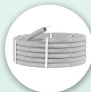
Гофрошланг D=16 Труба гофрированная с протяжкой, не распространяющая горение