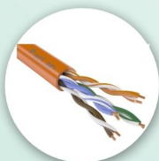
ParLan U/UTP Cat5e ZH нг(А)-HF 4x2x0,52 Кабель «витая пара» (LAN)